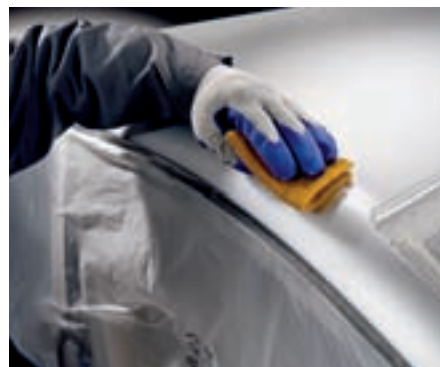
Dépolissage de peintures et laques sensibles