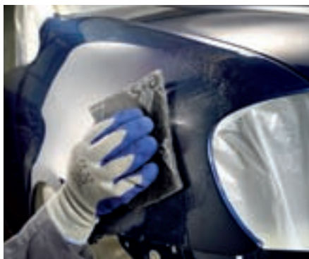
Dépolissage de peintures métalliques