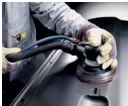
Ponçage de couches de fond d'usine